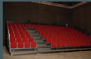
Espac Nuithonie Théâtre Mummenschanz Villars-sur-Glâne

Mobile Tribüne kombiniert mit 3er + 4er Sitzkombinationen mit Spezialfuss für Schnellmontage in diversen Konfigurationen.