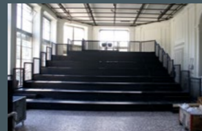
Théâtre de L'Orangerie La grande salle Genève

Mobile Tribüne kombiniert mit 3er + 4er Sitzkombinationen mit Spezialfuss für Schnellmontage in diversen Konfigurationen.