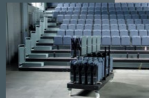
Théâtre Populaire Romand TPR Auditorium La Chaux-de-Fonds

Mobile Tribüne kombinierbar in 3 verschiedenen Konfigurationen bis 3,2 m Höhe. Sicherheitsgeländer entsprechend den Anforderungen auf Tribünen.